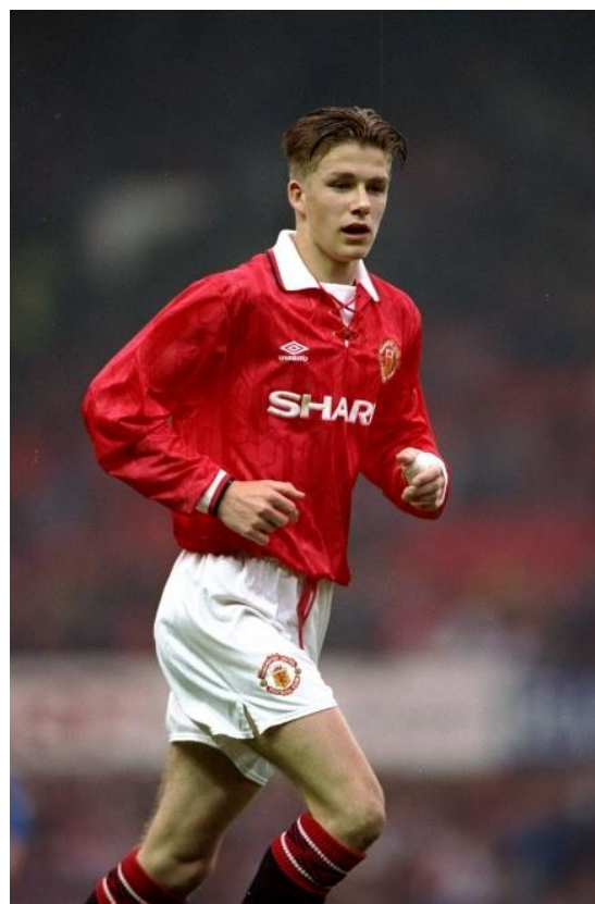
David Beckham Top 10 goals | Manchester United (manutd.com)

Seriál můžu velice doporučit, je to opravdu velmi povedené. Vše je ke zhlédnutí na platformě Netflix.